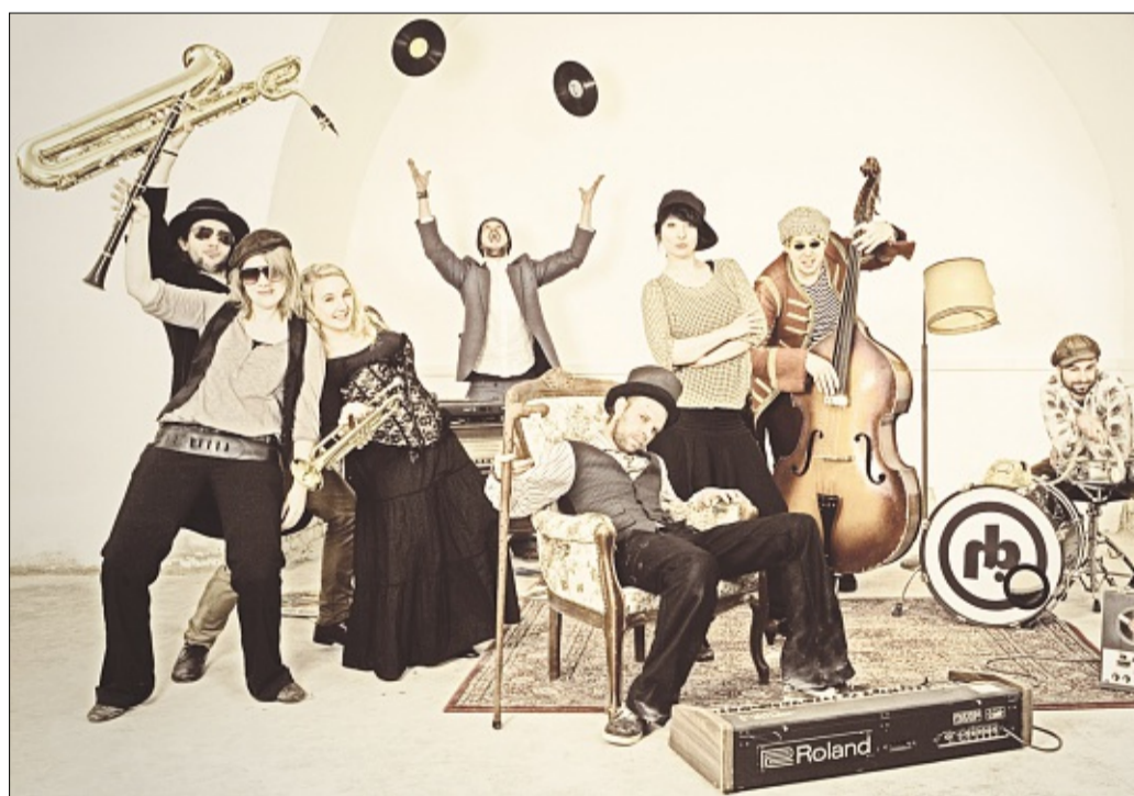
Funk, Swing und Rap vom Balkan bietet die Band „Brösel“.

Auf zwei großen Bühnen im Wechsel stellen die Topacts ihr Repertoire vor. Dabei legt man hier im verschlafenen und idyllisch gelegenen Wagersrott ganz besonderen Wert auf eine hervorragende Akustik, auf eine gute Lichtshow und gute Ton-technik. Die gute Stimmung kommt so von ganz allein. Allerdings gilt immer „The same procedure as last year?“ und so organisieren, buchen, regeln alle Beteiligten schon viele Monate vorher, was für den Besucher während des Festivals so selbstverständlich erscheint. Gut zu wissen, dass der junge Veranstalter dieses Event nicht zum ersten mal durchführt und von Jahr zu Jahr Verbesserungen