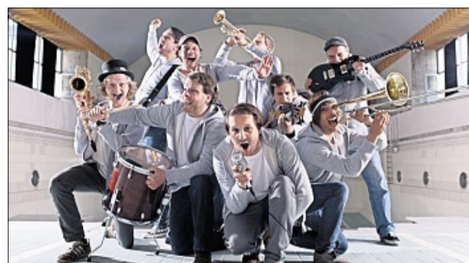
Tequila And The Sunries Gang.

„einbaut“. So ist beispielsweise in diesem Jahr eine An- und Abreise stilecht mit der Angeler Dampfeisenbahn und in Bussen möglich. Nach wie vor unterstützen neben regionalen Firmen wie zum Beispiel dem Bauunternehmen Greve, Ideen in Metall Handewitt, Flensburger Pilsener, Fahrschule Dirk Hartz, Schleswiger Stadtwerke, Containerdienst Angeln, Sanitär Sonne und mehr, Insound Kiel und Baumaschinenverleih Lassen auch Institutionen wie die Allianz Kulturstiftung, das Kulturreferat der Uni Flensburg, die NOSPAs Kulturstiftung und die